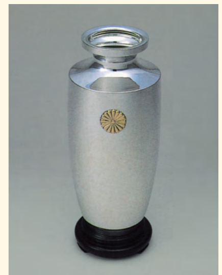
賜品「御紋付銀花瓶」(第34回まで)