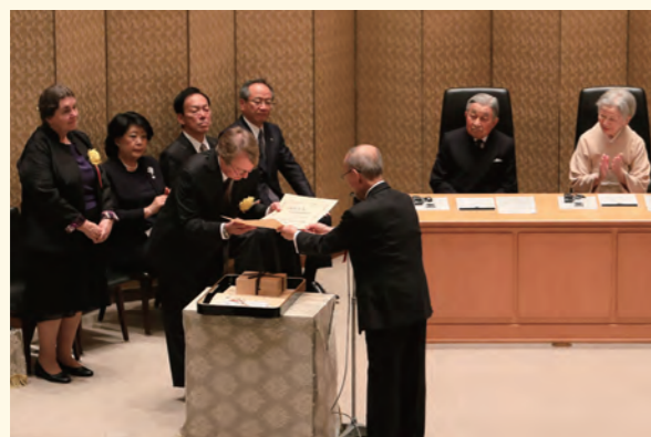
第34回授賞式(受賞者:アンドリュース・ハーバート・ノール博士)