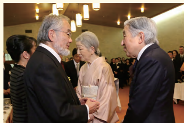
大隅良典博士(第31回受賞者)と天皇后陛下(当時) (記念茶会にて)